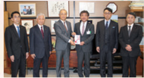
ウクライナへの人道支援・寄付