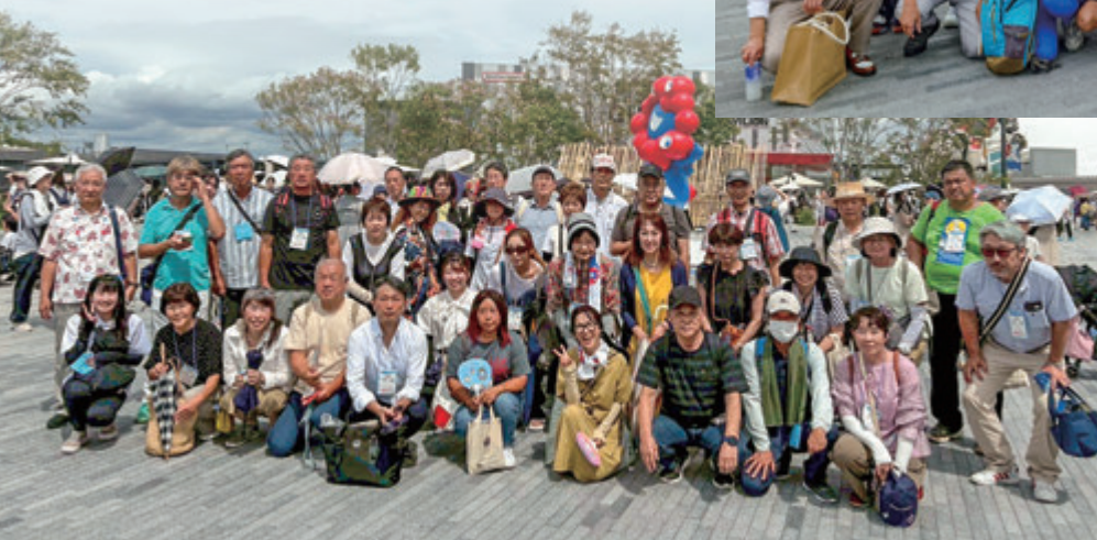
9月11日 万博集合写真