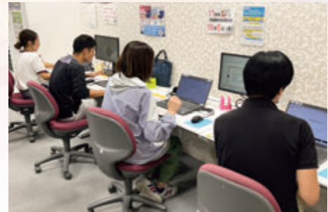
【小売業部会・卸売業部会】 チャットGPT実践講座