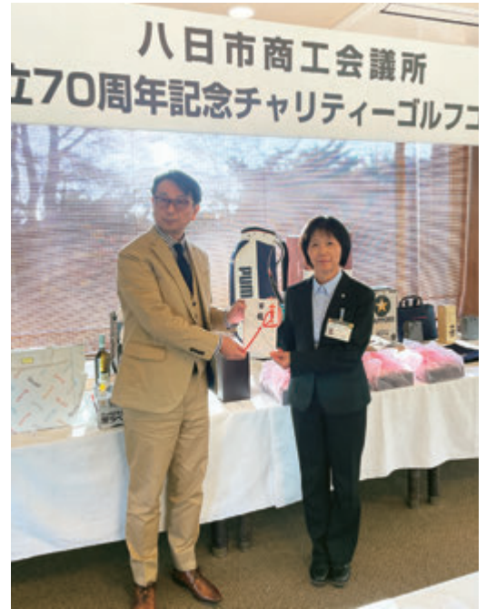
東近江市こども未来夢基金へ寄付を贈呈