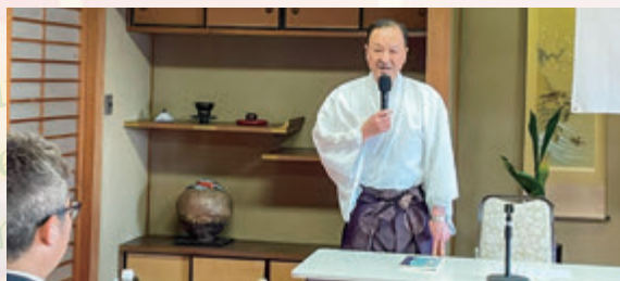
【観光物産振興委員会】座談会