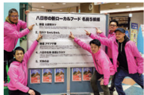
八日市の新ローカルフードお披露目会