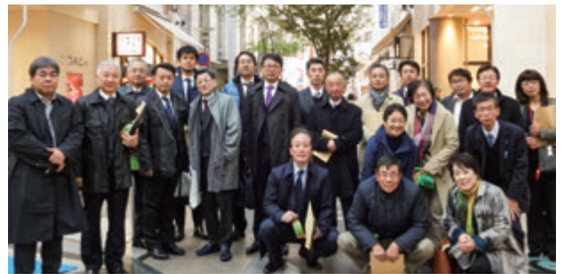
【市民生活部会】香川県高松市視察