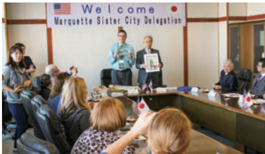
マーケット市友好親善使節団と懇話会