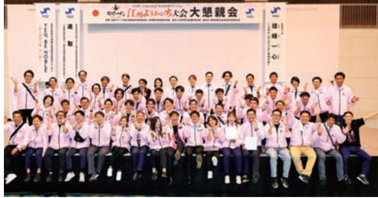
第42回近畿ブロック大会 江州ようかいち大会