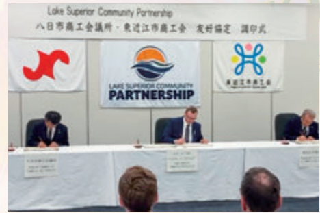
マーケット市経済団体LSCPと友好協定締結