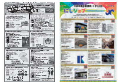
働き方改革推進支援事業・合同求人広告掲載