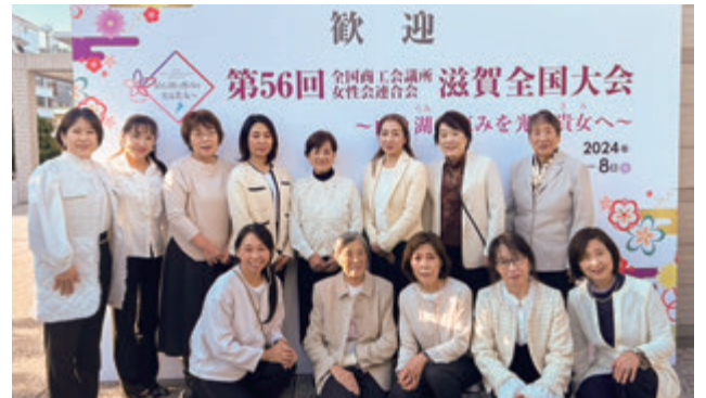
第56回全国商工会議所女性会連合会滋賀全国大会