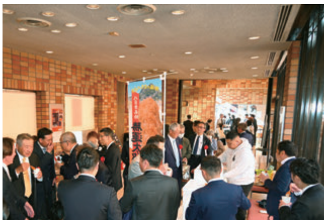
新ローカルフード「勝運太郎棒カツ」試食