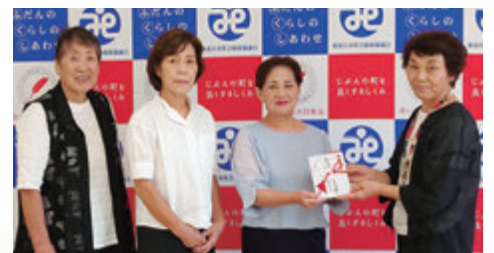
善意銀行への寄付