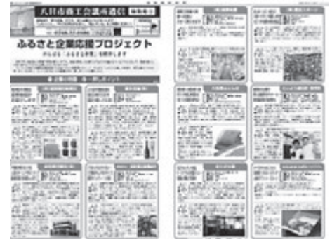
「ふるさと企業紹介」を発行