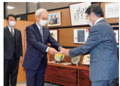
第2期東近江市中心市街地活性化協議会の意見書を市長に提出