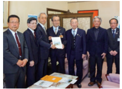
国土交通大臣に要望