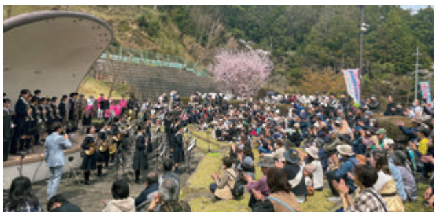
さくらはるまつり