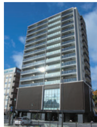
八日市商工会議所新会館