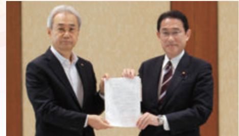
岸田文雄衆議院議員に要望