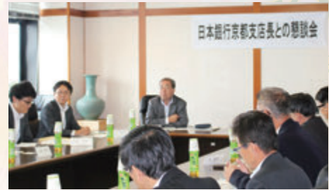
日本銀行京都支店長との意見交換会