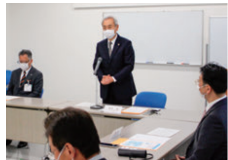
行政・金融機関・経済団体による 新型コロナ支援策情報交換会