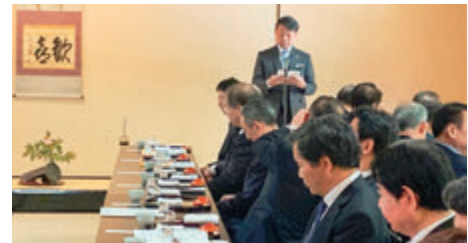
新事務所お披露目式