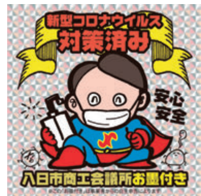
【市民生活部会】 新型コロナウイルス対策済み 安心・安全ステッカー配布