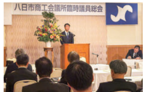
第25期臨時議員総会