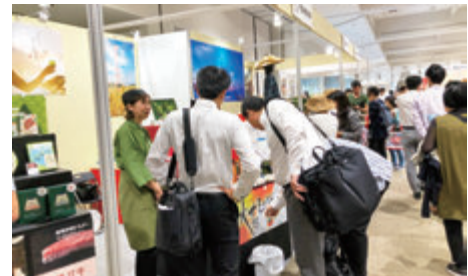
「大阪インターナショナルギフト・ショー2019」 出展支援