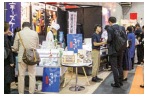
食品展示会「FABEX関西」出展支援