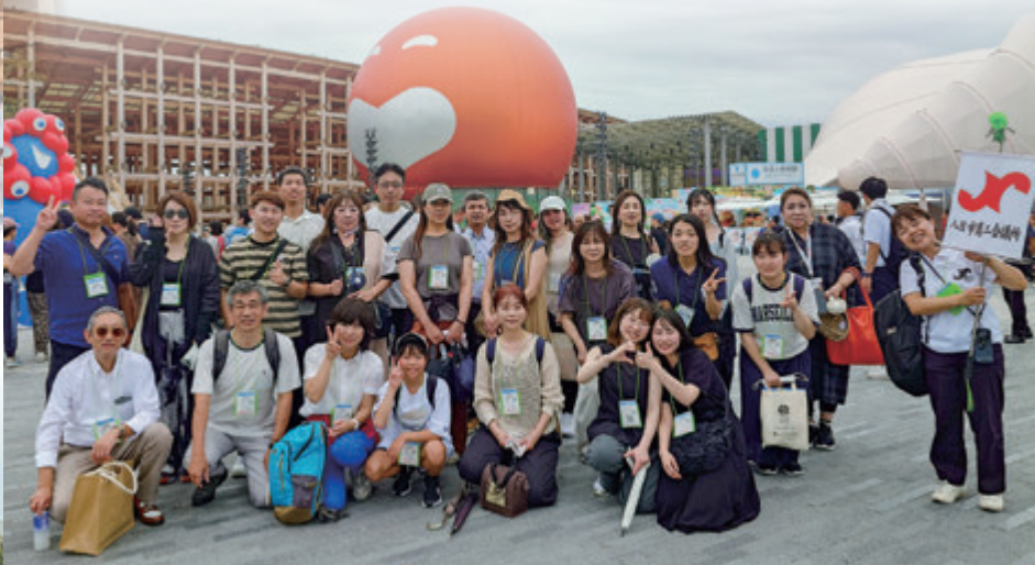
9月4日 万博集合写真