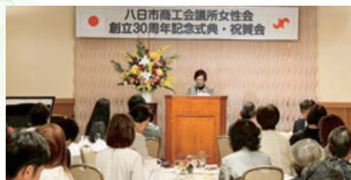
女性会創立30周年記念式典