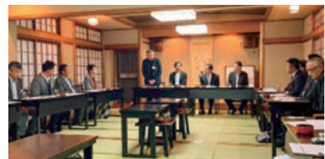
【建設業部会】東近江市商工会 建設業部会との交流会