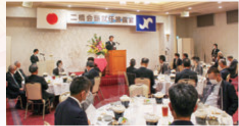
二橋会頭就任披露宴