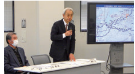
黒丸スマートインターチェンジ準備会開催