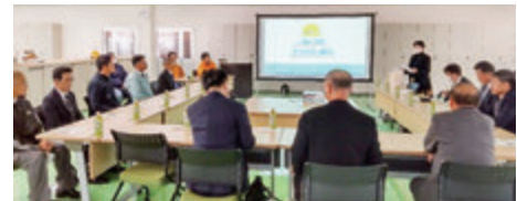
【工業部会】 (株)大紀アルミニウム工業所・(株)聖心製作所視察