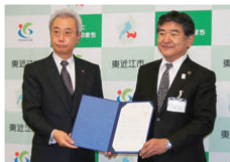
「中心市街地活性化基本計画案」意見書提出