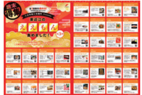
合同折込チラシ「東近江のええもん集めました！」