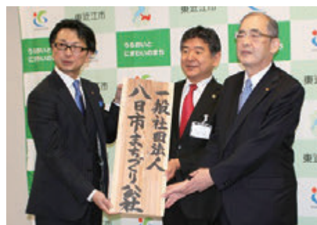
(一社)八日市まちづくり公社設立