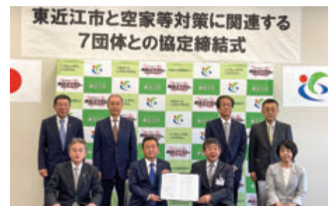
東近江市と空き家等対策に関連する7団体との協定締結式