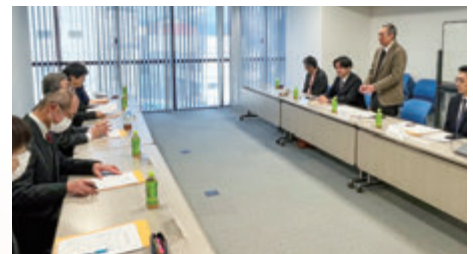
【小売業部会・サービス業部会】 龍野商工会議所との意見交換会