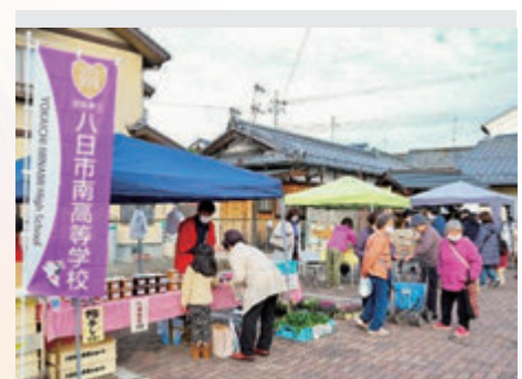
ようかいち太子マルシェ