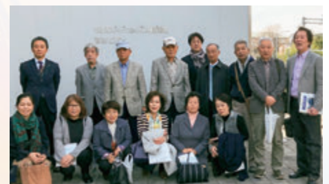
【市民生活部会】BRT視察研修