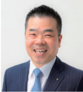
滋賀県知事 三日月 大造