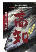
<商品ガイドブック(前回)>