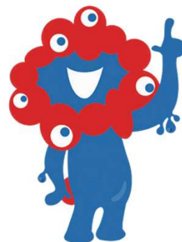
公式キャラクター ミャクミャク